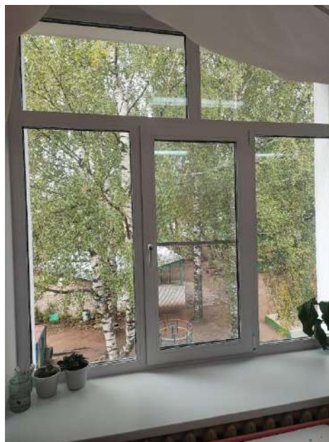
Фото оконных блоков в музыкальном зале.