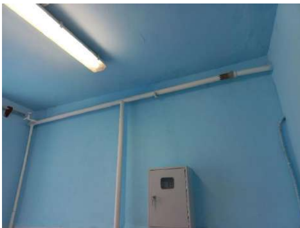
Фото потолка в раздевалке старшей группы «А» Фото потолка в туалете средней группы «А»