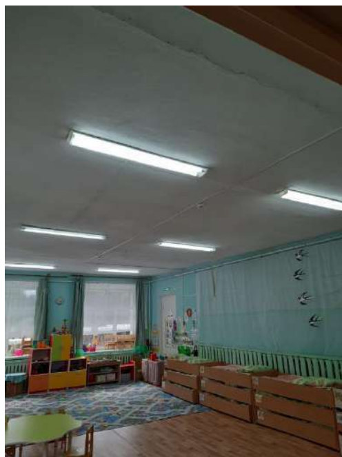
Фото искусственного освещения в средней группе «А»