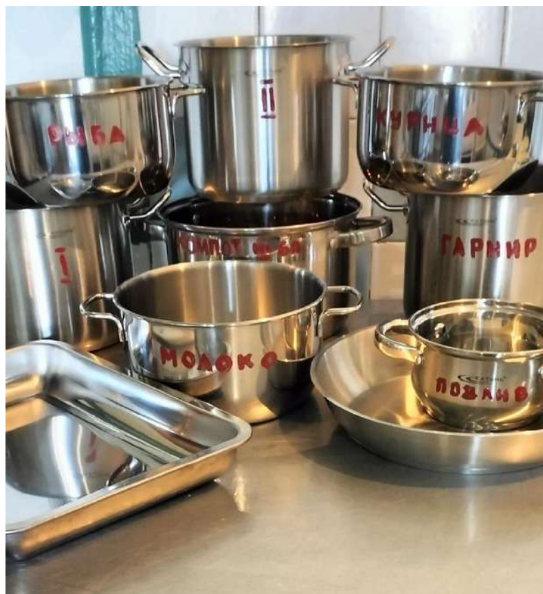
Фото посуды из нержавеющей стали